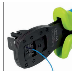
Art. No. 616 667 3 1